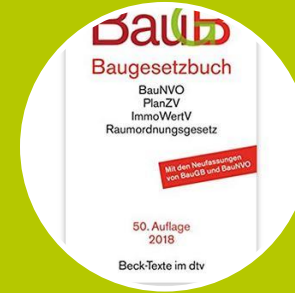
Planungsrechtlicher Handlungsspielraum + (Umsetzungsszenarien) Unterstützungsleistung